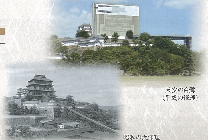
天空の白鷺 (平成の修理)