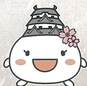
姫路市キャラクター しろまるひめ